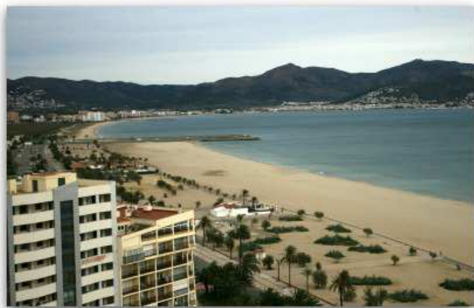
El passeig d'Empuriabrava (aquí en imatge d'arxiu), s'està reformant

Un qüestionari al web de l'Ajuntament pregunta a la població les seves preferències pels acabats, enjardinaments i equipaments que volen al passeig