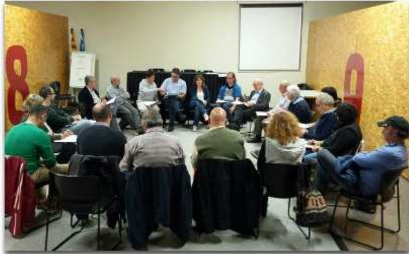
Constitució del Consell de Participació Ciutadana de Palamós.

El Consell de Participació Ciutadana de Palamós ha aprovat el seu nou reglament, amb l'objectiu d'obrir-se encara més a la població. Segons aquesta nova norma, el Consell no establirà un límit màxim de participants i només hi haurà la condició d'un compromís de contínuïtat. La constitució oficial del nou Consell de Participació Ciutadana es farà en una pròxima reunió, a finals d'aquest mes de novembre.