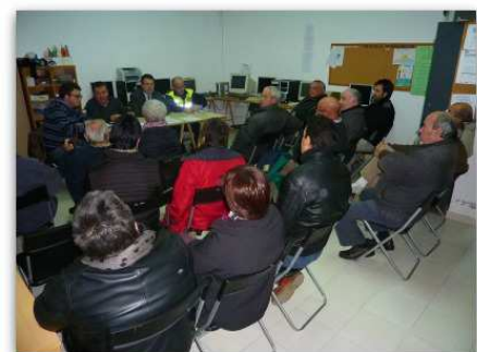
Una sessió del Consell de Barri de Canaleta fa dos anys.

Avui tindrà lloc el de la Farga i en les pròximes setmanes, els altres quatre