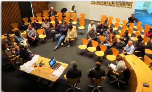
Els assistents a la segona Audiència Pública

Una quinzena de persones assisteixen a la segona audiència pública, en què es va presentar una línia continuïsta