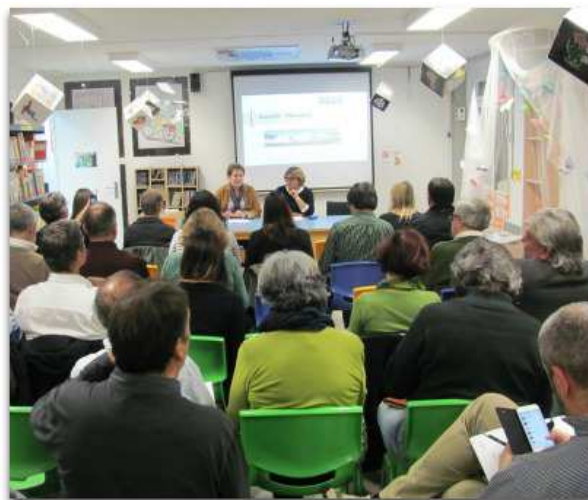
Un moment de la sessió d'ahir del Consell Municipal d'Educació a l'escola El Bosc de la Pabordia

Dani Vilà. La ciutat de Girona crearà aquest mateix curs el consell d'infants de la ciutat de Girona amb la voluntat de fomentar la implicació dels alumnes de deu a dotze anys amb la ciutat. Així es va assenyalar en el Consell Municipal d'Educació de Girona, que ahir es va dur a terme a l'escola El Bosc de la Pabordia.