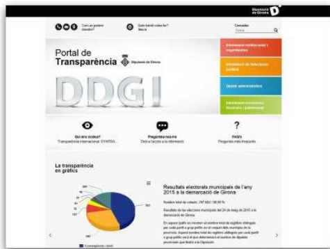
Captura del Portal de Transparència de la Diputació

Es fa públic l'informe de l'ONG Transparència Internacional, que li ha atorgat 92,5 punts sobre 100