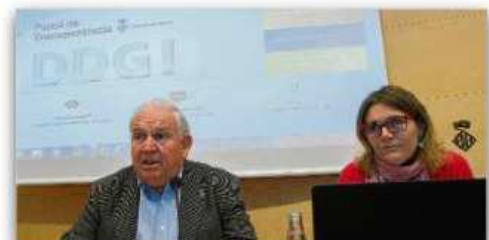
Foto d'arxiu de la presentació de l'Oficina de Transparència de la Diputació de Girona, aquest desembre. Martí Artalejo

GIRONA | P.E. L'organització Transparència Internacional Espanya va presentar ahir els resultats de l'Índex de Transparència de les Diputacions (INDIP) d'aquest any 2015. L'INDIP ha analitzat les 45 diputacions provincials de l'Estat (inclosos dos «cabildos» canaris, dos consells balears i tres diputacions forals). Els resultats situen la Diputació de Girona a la posició número 12 -del total de 45- en la valoració global de l'índex de transparència. La institució provincial ha aconseguit 92,5 punts sobre 100 (per tant, es pot traduir en una nota excel·lent de 9,2 sobre 10).