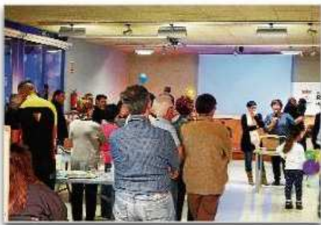
Riudellots celebra la fira de les entitats. Xevi López

Riudellots de la Selva ha celebrat aquest cap de setmana la XI edició de la Fira d'Entitats locals. Els actes van iniciar-se divendres i s'han allargat fins diumenge a la tarda. Concerts, jocs, exposicions, castanyada, tallers i una gimcana tecnològica amb codis QR per descobrir els secrets de les entitats han omplert la programació durant tot el cap de setmana. Amb aquesta fira es pretén posar en valor la tasca que realitzen les entitats del municipi.