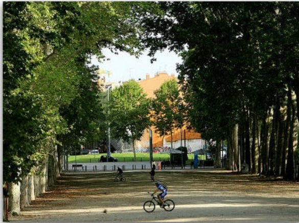
Un ciclista passant un dia d'aquest mes d'agost pel mig de la Devesa de Girona

L'alcalde de Girona, Carles Puigdemont, està disposat a reobrir el debat sobre els futurs usos de la Devesa en aquest mandat amb la voluntat d'impulsar "un debat real" del gran parc urbà de la capital gironina. Puigdemont considera que el procés participatiu que va fer el govern tripartit va ser "insuficient" i "dirigit" i que al darrere hi havia la voluntat de "buscar unes conclusions determinades". Per això, CiU té la intenció d'obrir "un debat de ciutat" que s'assimili a "un congrés" en què puguin participar tècnics de medi ambient, arquitectes, artistes, literats o paisatgistes.