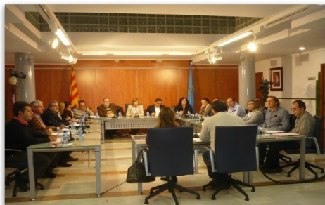
El ple de Palamós que va aprovar els integrants del consell de desenvolupament econòmic i social.

Els ajuntaments de Palamós i Palafrugell han tirat endavant els consells de desenvolupament econòmic i social, que intenten aplegar els sectors públic i privat per unir esforços contra la crisi. L'Ajuntament de Palamós ja va aprovar en el ple d'aquest mes els integrants del consell, en què descarta la presència d'un membre de cada grup municipal de l'oposició. Tot i això va rebre atacs del PP pel fet de considerar que la proposta "arribava tard". El nou organisme, però, a part de polítics, té una àmplia presència de persones de diferents àmbits econòmics i socials del municipi. La constitució del nou ens es farà el pròxim 17 de desembre. D'altra banda, a Palafrugell, la proposta del nou consell s'ha aprovat inicialment, encara que no té tot el suport de l'oposició, ja que veu en aquest nou organisme elements similars a l'actual Institut de Promoció Econòmica de Palafrugell (IPEP). El govern intenta diferenciar els dos organismes.