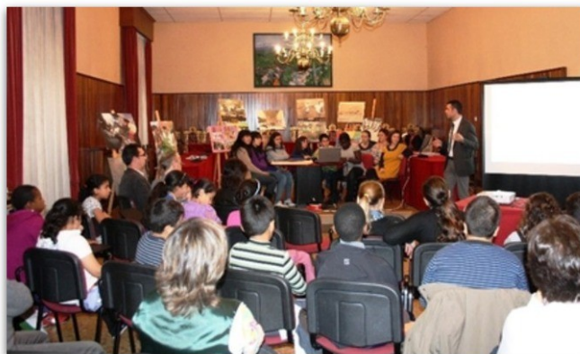
Imatge de l'acte fet al saló de plens de l'ajuntament de Figueres de la campanya "El barri que volem".