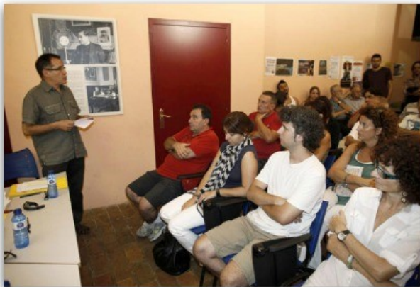
La trobada va comptar amb la participació de desenes de persones a Can Met.

Historiadors de la ciutat fan una crida a la discussió per poder dissenyar un pla que impliqui Figueres