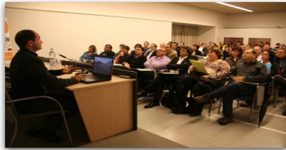
Foto. El primer Fòrum ciutadà va tenir lloc a l'Auditori de la Mercè

En el darrer ple municipal es va dir que la intenció inicial era celebrar-lo aquest setembre