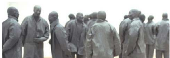
Associació Ciutadana per a la Participació

L'U de maig del 2010, va néixer a Roses l'entitat Associació Ciutadana per a la Participació (ACPROSES) com a resposta a la voluntat de participar en aquelles actuacions que afecten el nostre entorn urbà. La seva missió serà recollir les propostes dels ciutadans de Roses a fi de millorar no solament la nostra imatge de qualitat sinó també la nostra realitat.