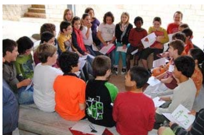
Un grup de nens participen en l'elecció d'un logotip pel barri.

L'Ajuntament diu que abans que s'acabi aquest any es començaran les obres en aquesta zona reivindicada del barri