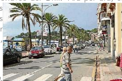
La reforma del passeig principal de Lloret ha generat molt debat.