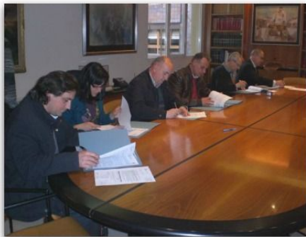
Responsables de les entitats culturals firmant els convenis, aquest dilluns.

L'Ajuntament de Banyoles ha renovat els convenis amb les entitats de la ciutat per valor de 360 mil euros. Es tracta d'una xifra un 10% inferior a fa dos anys, i beneficia una quarantena d'entitats locals.