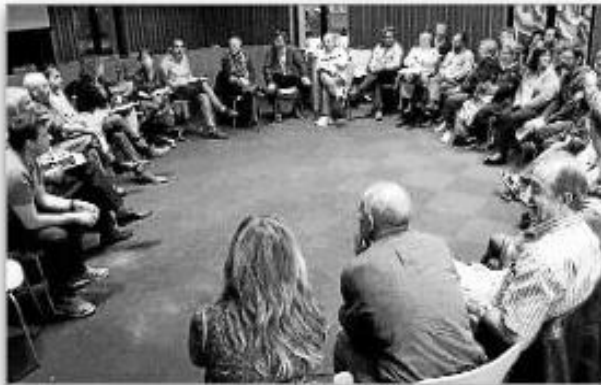
La reunió entre l'Ajuntament i les entitats de la vila de Blanes.

L'Ajuntament de Blanes comença a treballar en l'organització de la VI Fira d'Entitats i més de 70 persones van participar en una primera reunió per posar en comú diverses qüestions relacionades amb aquesta activitat, que ja s'ha acordat que es farà a Blanes el darrer cap de setmana de setembre. A la reunió hi van assistir representants de les associacions del municipi de tots els àmbits.