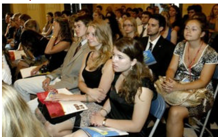
Recepció de l'Ajuntament de Girona.

Prop de 170 joves de 25 països de la UE debaten temes d'actualitat i fan propostes al Parlament Europeu