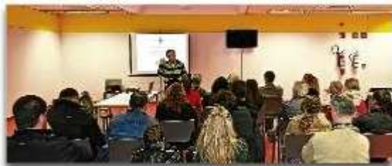
La sessió de dimecres, a la sala polivalent del centre cultural Can Roig. Canal Ajuntament

Les iniciatives ciutadanes fan referència bàsicament a les persones, l'urbanisme, l'economia i el medi ambient