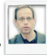
OPINIÓ. FRANCESC TORRALBA ROSELLÓ

”Quan regna l'opacitat, es crea un clima de suspicàcia i de por, de permanent desconfiança, que solament porta al tribalisme”