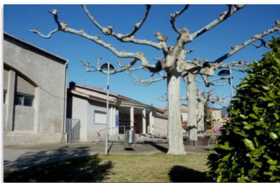
Exterior del centre cívic, equipament que serà ampliat i reformat.

L'augment puntual d'ingressos permetrà fer inversions per 800.000 euros