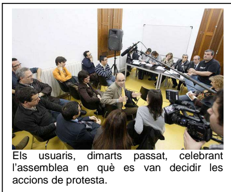
Els usuaris, dimarts passat, celebrant l'assemblea en què es van decidir les accions de protesta.

La companyia diu que servirà per respondre les reivindicacions, però els passatgers creuen que és "paper mullat"