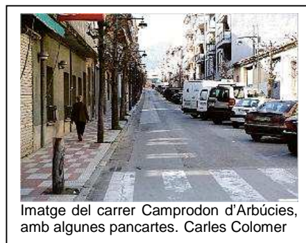
Imatge del carrer Camprodon d'Arbúcies, amb algunes pancartes. Carles Colomer

En aquests moments, un cop acabats els tallers participatius, s'està redactant el projecte, segons el criteris que es van acordar en els debats i, en breu, es presentarà en el marc de la Comissió de Seguiment del Procés Participatiu. La protesta dels veïns descontents per la reforma del carrer Camprodon es fa palesa al municipi amb pancartes penjades a finestres i balcons del carrer.