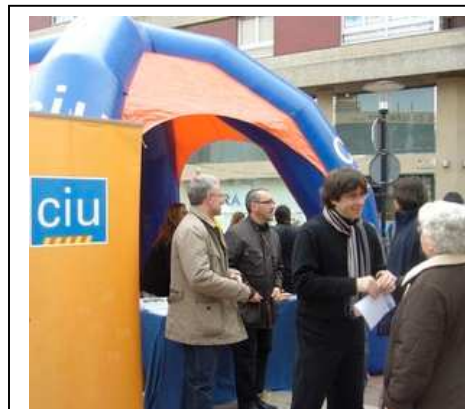
Puigdemont a la parada, atenent una senyora.

A Olot, CiU també va fer ahir un gest d'aproximació als ciutadans amb la instal·lació d'una parada a la plaça Clarà. Josep Maria Corominas (portaveu i probable candidat el 2011) i alguns companys de partit van intercanviar impressions amb els vianants. «La idea –va resumir Corominas– és explicar-nos i alhora captar les idees dels olotins.» La parada va servir també per anunciar el congrés de CDC de la Garrotxa, previst pel 14 de març. S'hi debatran quatre ponències referides a l'organització interna, les seves relacions amb la societat, les infraestructures i la situació del partit a la comarca amb vista a les properes municipals.