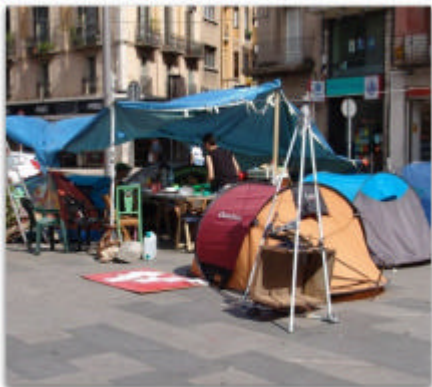
El campament de la placeta baixa de la Rambla.

És de les poques ciutats on "el campament" encara es manté