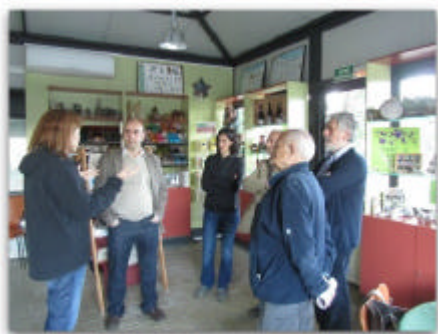
Visita del verificador i representats del sector turístic al Punt d'Informació de Sant Esteve de Palautordera

Actualment, 77 espais protegits de tot Europa gaudeixen d'aquesta acreditació, però a Catalunya són només quatre els territoris acreditats: la Garrotxa, el Delta de l'Ebre, i aquest any s'hi afegiran el Parc Natural de Sant Llorenç del Munt i l'Obac i el Montseny.