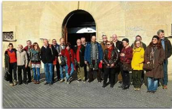
Representants d'una vintena d'entitats olotines a la porta de l'Ajuntament. X.V.

A la ciutat hi ha dos locals que, segons la Coordinadora de les associacions, són insuficients