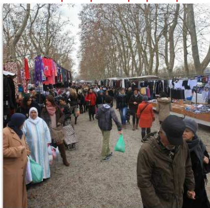
El mercat bisetmanal que se celebra els dimarts i dissabtes al parc de la Devesa i al vial perimetral

Lamenten que el procés pel pla especial no tingui calendari ni prevegi inversions per fer millores al parc ràpidament