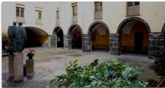
El pati interior de l'antic hospital, des d'on es podrà accedir a l'oficina de turisme i a una sala d'actes.

La intervenció més immediata serà el trasllat de l'oficina de turisme, que finalment se situarà a la cantonada del carrer Sant Rafael i del Doctor Fàbregas, i no pas a la façana del carrer Mulleras com s'havia planejat inicialment. Ocuparà uns 240 metres quadrats i s'hi podrà accedir per la cara que dona a la plaça Mercat i pel pati interior. El projecte té un pressupost d'uns 250.000 euros, dels quals 140.000 estan subvencionats. L'alcalde va anunciar ahir que "aviat" es donarà la corresponent llicència d'obres. Completarà l'oficina pròpiament dita una sala d'actes que es construirà a l'ala oposada del pati interior.