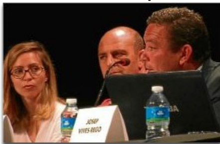
Alguns dels ponents al seminari organitzat per EMP. ddg

SANTA CRISTINA D'ARO | DDG El partit Emprenedors per Santa Cristina i la revista Llum va organitzar a l'Espai Ridaura de Santa Cristina d'Aro un seminari sobre els reptes de la política social del segle XXI. En la taula es va posar a debat l'evolució del model sociopolític actual i la necessitat dels partits polítics a adaptar-se a les noves demandes de la societat.