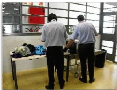
Els preparatius, ahir, per poder rebre avui els primers presos. acn

Justícia inicia avui el trasllat dels 150 interns cap al nou centre i divendres s'activarà un nou servei d'autobús Llançadora