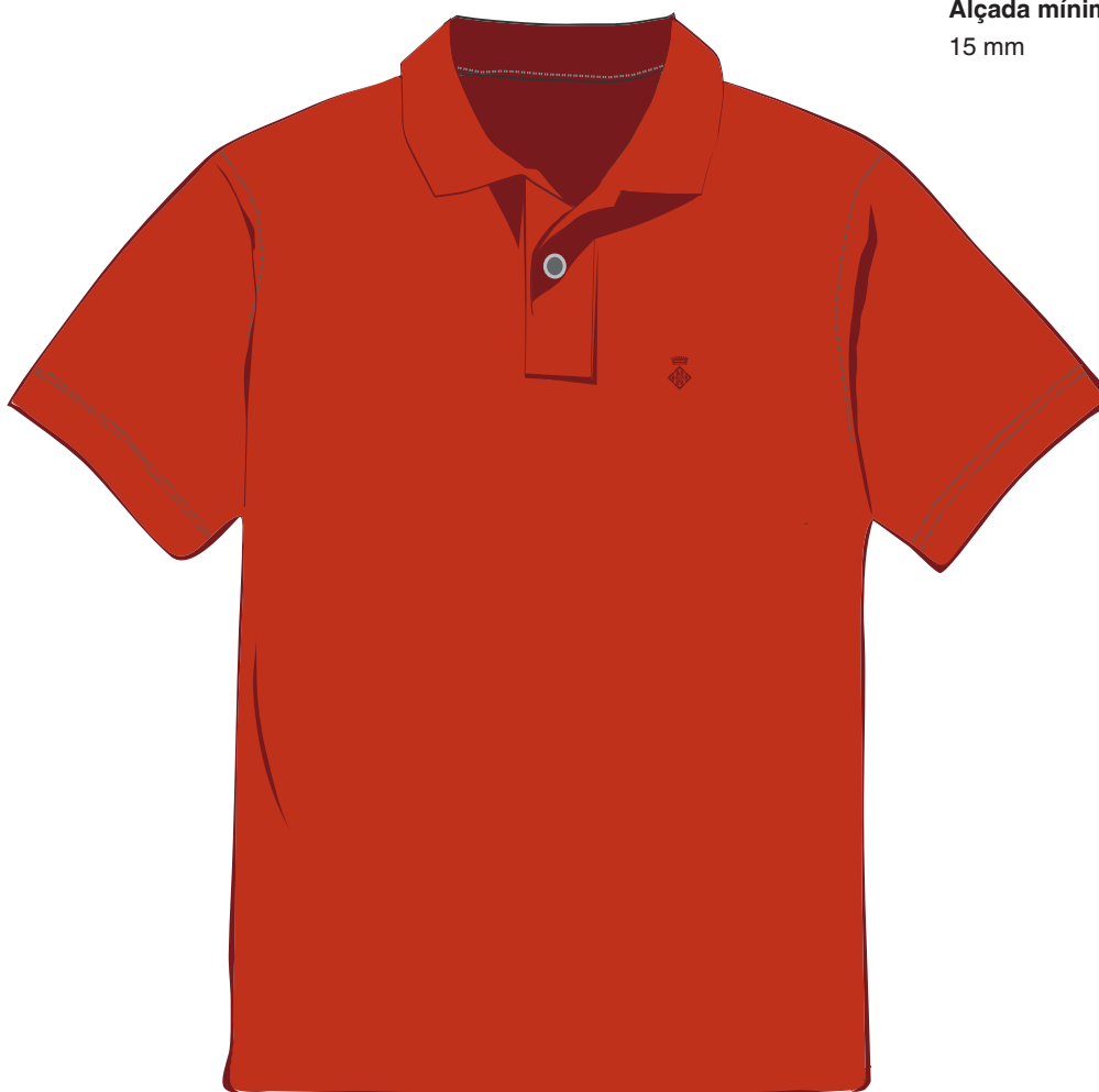
POLO DE COLOR GRANAT Alçada mínima del senyal: 15 mm

El color del senyal brodat o imprès per serigrafia ha de ser el granat fosc perquè sigui visible.