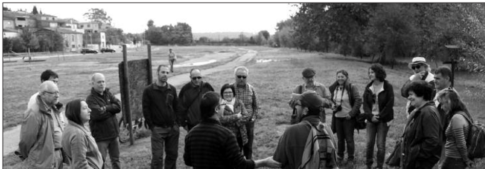
Colomés, parc fluvial i resclosa. Inici de la sortida.

Reprenem el camí fins a Verges, on el rec del Molí flueix pel mig del municipi i arriba a un molí, ara abandonat. A tocar del rec s'alça can Ponton, la casa pairal de la família Albert, besavis de l'escriptora Caterina Albert, Victor Català . Tot i que la casa encara no està oberta al públic, ens van perme-