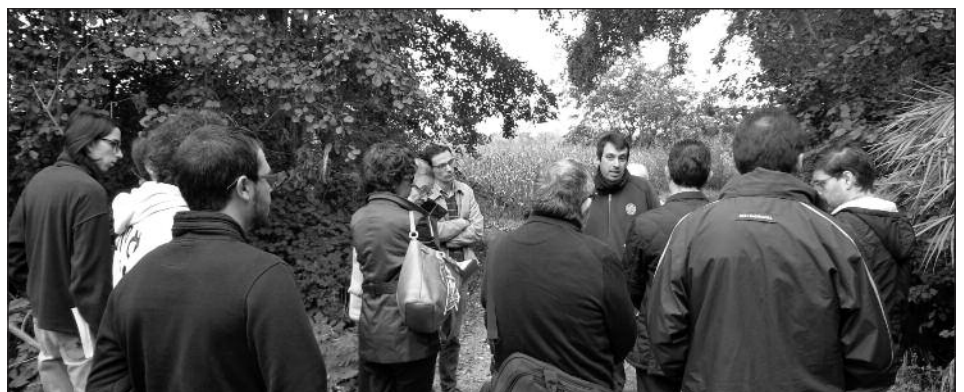
Dissabte 22 d'octubre, treball de camp sobre la sèquia de Fontanet i la sèquia de Torres de Segre.

Gabriel Ramon Molins Departament d'Història, UdL ■