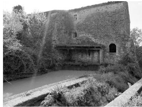
Molí de la Salvetat de Jafre.

A continuació vam agafar els cotxes en direcció a Jafre i a uns 300 metres a la dreta