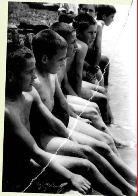
Rafael Vilarrubias. Clínica de maternitat. Nen en tractament. Igualada, 8 de juliol del 1937. A la dreta, nens refugiats de la Guerra Civil banyant-se a l'estany. Banyoles, juny 1937.

Inspai, centre de la imatge de la Diputació de Girona participa en el festival Visa pour l'Image presentant a la Médiathèque l'exposició Fotoperiodisme a la rereguarda (1936-1939) . Rafael Vilarrubias, del fotògraf Rafael Vilarrubias (Igualada, 1905-Banyoles, 1953). L'exposició aplega les imatges més representatives, publicades en el suplement de La Vanguardia , Notas gráficas , sobre la vida i el treball a la rereguarda catalana durant la Guerra Civil espanyola. S'hi mostren les fotografies preses pel fotògraf i el tractament que van rebre en la premsa gràfica del moment en una època de molta rellevància de la imatge en la premsa. Inspai, centre de la imatge de la Diputació de Girona, gestiona des del 2006 el fons Rafael Vilarrubias, cedit pel seu net Esteve. Vilarrubias es va aficionar a la fotografia a la seva ciutat natal, Igualada. L'any 1931 es va traslladar a Banyoles, on va començar a dedicar-se professionalment a la fotografia. Al llarg de la seva trajectòria va compaginar la feina de retratista, fotògraf artístic i fotoperiodista fins a la seva mort prematura, l'any 1953.