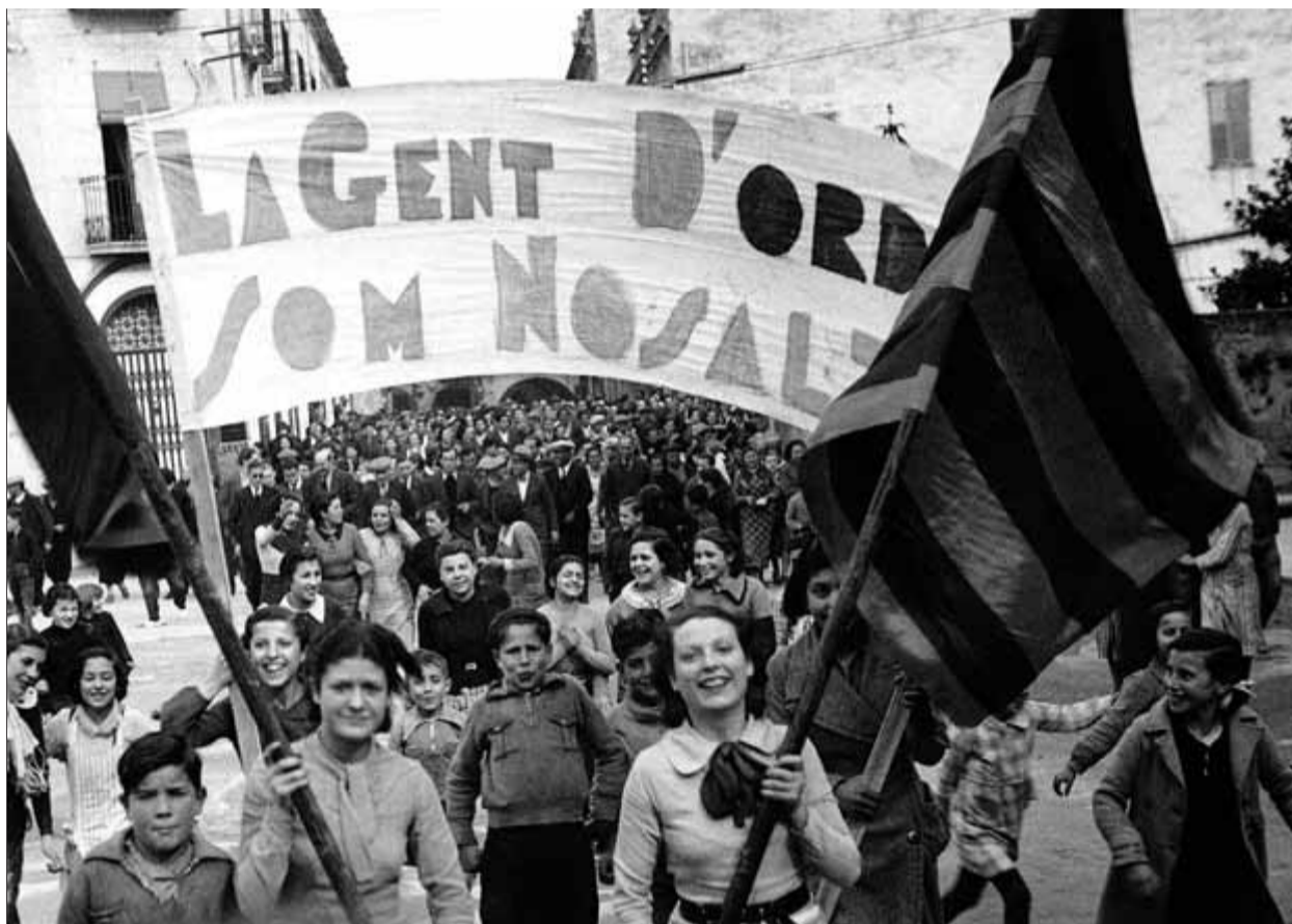
Una de les fotografies del fons de més de 800 imatges de Rafael Vilarrubias que custodia el centre Inspai

Nascut a Igualada, on era escrivent en una blanqueria, Rafael Vilarrubias (1905-1953) es va establir a Banyoles el 1931, atret per les imatges de la ciutat que havia vist reproduïdes en un cartell de la festa major, i l'any següent ja publicava el seu primer reportatge a La Vanguardia , sobre els aiguats que aquell més de desembre havien provocat el desbor-