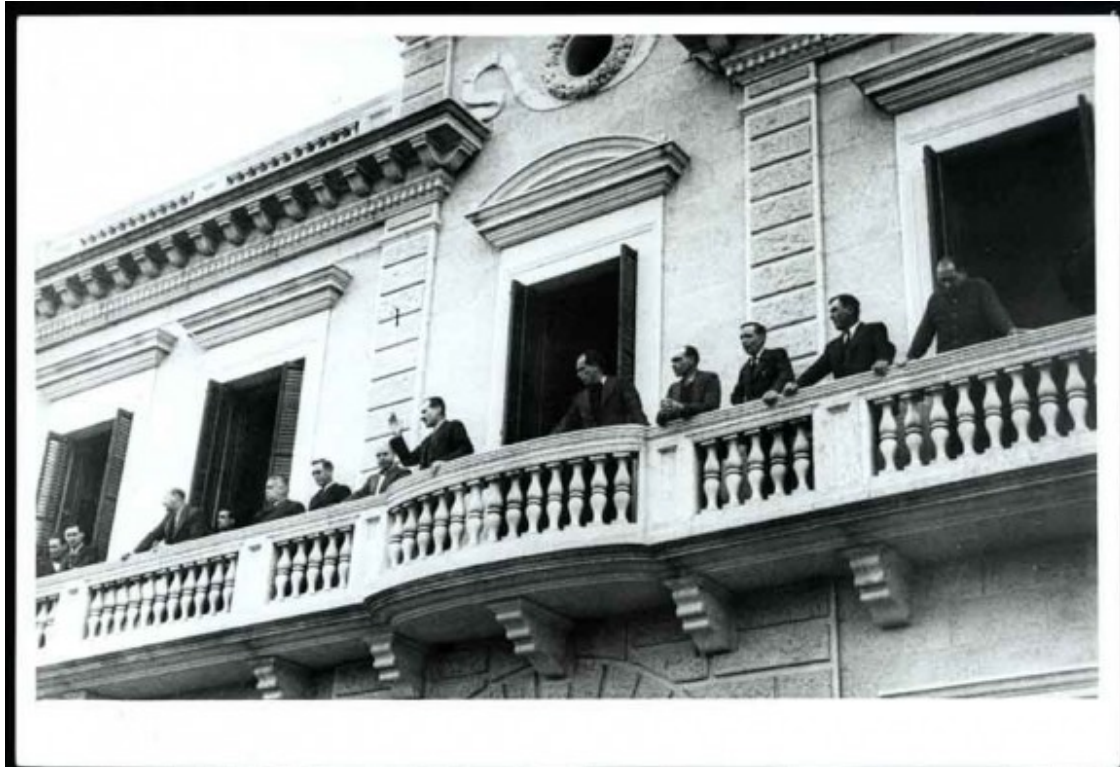
Manifestació amb motiu de la victòria del Front d'Ordre o d'Esquerres. Autoritats al balcó dirigit-se als assistents, 18 de febrer de 1936, Banyoles.

"Kaolack", de Joel López (el projecte guanyador de la II Biennial Internacional de Fotografia); "Àlbum de famílies", de Mattia Insolera i Catalina Gayà; "Abandoned places", d'Alícia Rius; "Fotografia de premsa", de Dani Duch; "La fi dels dies", de Yurian Quintanas; "Una altra manera de captar el món: 1979-2013", de Miquel Ruiz; "Polvorins", de Carles Palacio, i "Mentawai: progrés o retrocés?", de Marina Calahorra.