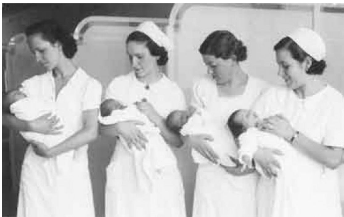
Clínica de maternitat: quatre infermeres amb nadons en braços, 8 de juliol de 1937, Igualada.

La Diputació de Girona gestiona des de l'any 2006 el fons arxivístic del retratista, fotògraf artístic i fotoperiodista mort prematurament l'any 1953