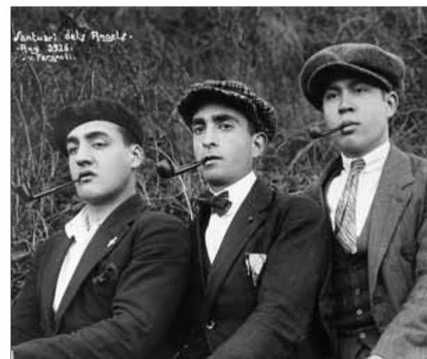
Tres membres de la secció dramàtica de la Societat Obrera l'Amistat al camí dels Àngels, el 1925