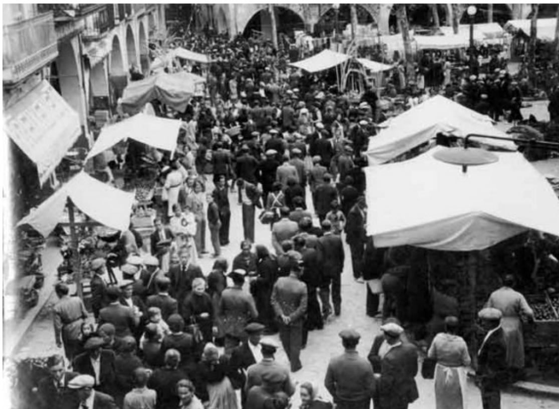
Mercat a la plaça Major (publicada a «Notas Gráficas», La Vanguardia), 5 d'abril de 1936, Banyoles.