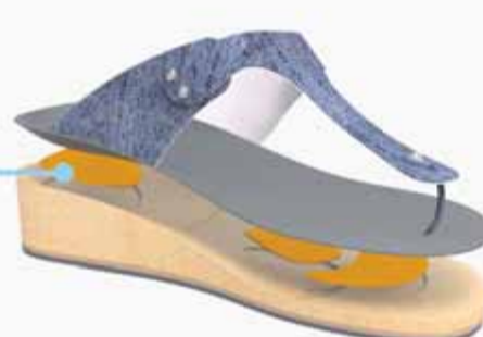
SANDÀLIES + PLANTILLA INTEGRADA

Dissena't la sandàlia Insoler amb la teva plantilla a mida integrada.