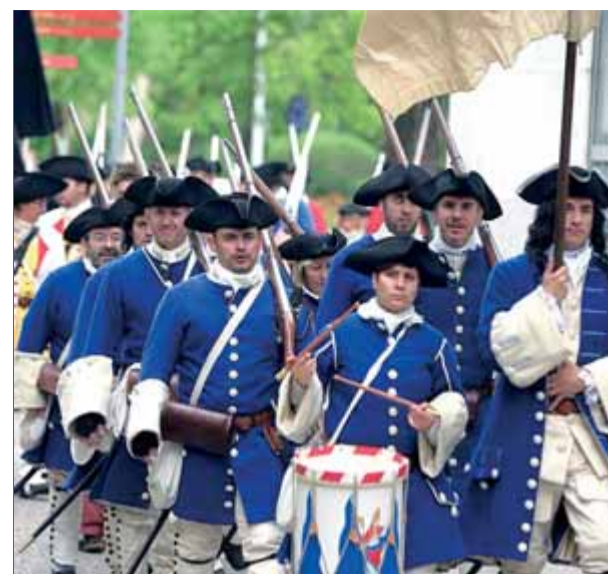
Una de les tropes que es van veure ahir

la vida espiritual i social que es va generar al centre, material antic com una vella (i inquietant) taula quirúrgica i d'altre material de la sala d'operacions... tot plegat per configurar un recorregut històric i també sentimental per les antigues instal·lacions i la seva història. Al final, s'hi ha posat un llibre de visites, a fi que tothom que ho desitgi expliqui els seus Moments viscuts al Santa Caterina. Serà, de ben segur, un altre document imprescindible per conservar la història de l'hospital i la seva relació amb Girona i els gironins. ■