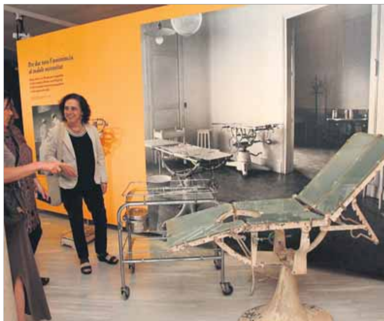
Una de les recreacions a l'espai expositiu Santa Caterina, en aquest cas d'una sala d'operacions amb una antiga taula quirúrgica ■ JOAN SABATER

Al passatge, s'hi han posat cinc grans arcs amb la cronologia i imatges de diferents aspectes del centre hospitalari: l'hospital i la ciutat; l'atenció al malalt; laboratoris, sales d'operacions i farmàcia; vida a l'interior, i l'hospital visitat i celebrat són els temes que s'hi tracten. El pas pels arcs acompanya, a poc a poc, el visitant en una particular immersió cap al passat, ja a l'espai expositiu Santa Caterina. L'hi introdueixen amb una mirada al passat més recent, el del silenci que va senyorejar els seus murs a partir del 2004, quan va