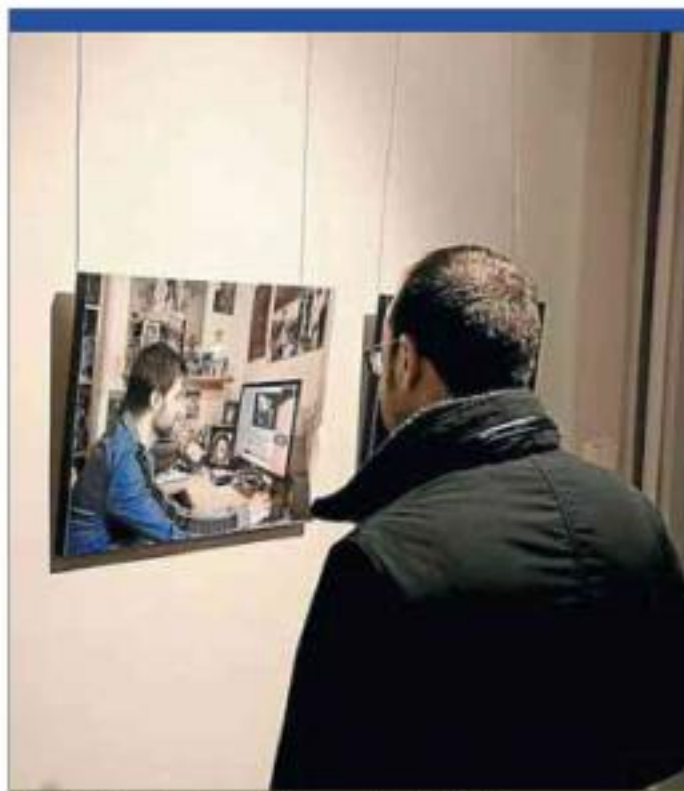
Les fotos són obra d'alumnes de l'ERAM ■ MANEL LLADÓ

► 20.00. Can Gruart. Taula rodona: Com compaginar vida familiar i vida laboral? amb la participació de Laia Fàbregas,