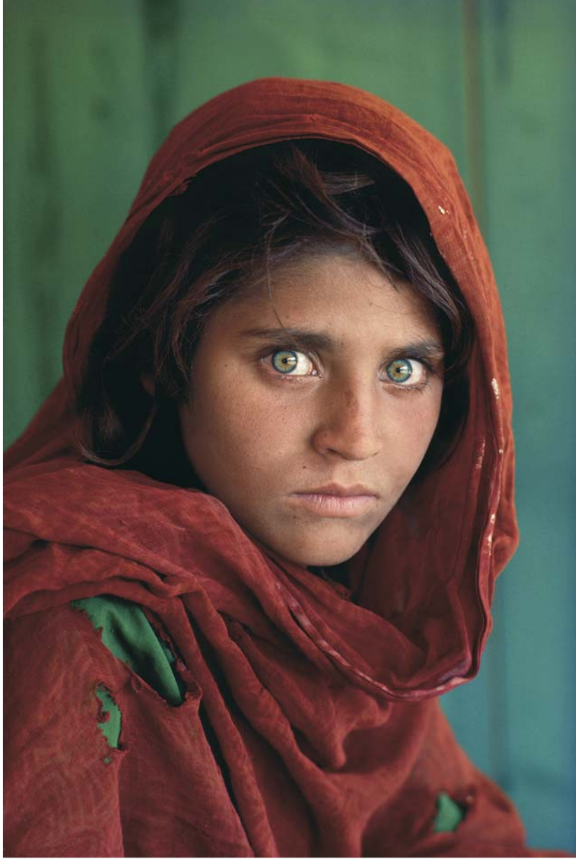
Peshawar, Pakistan