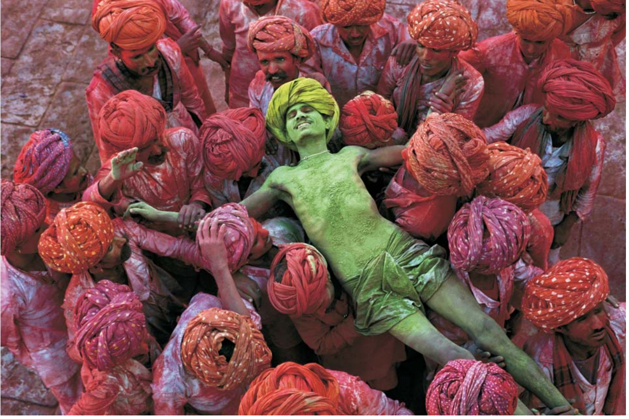
Rajasthan, India