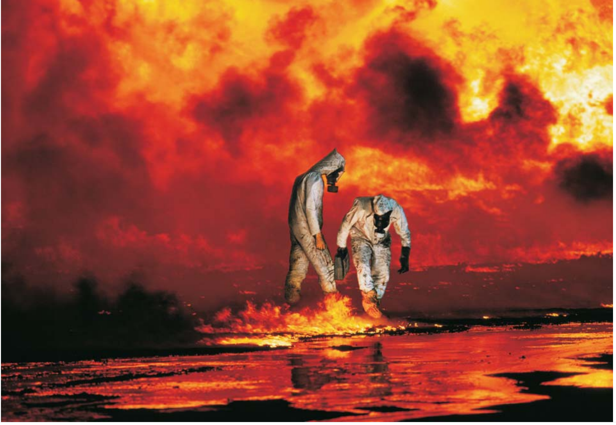
Ahmadi, Kuwait