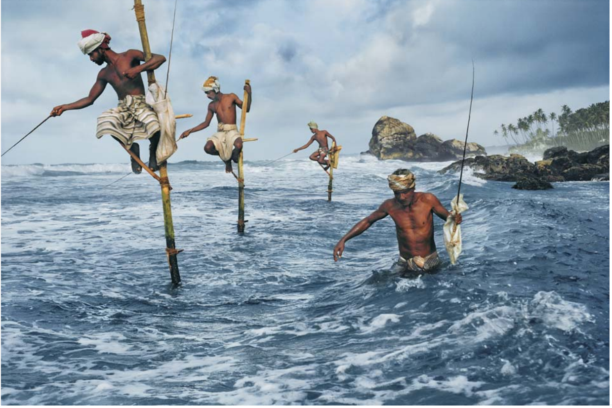
Weligama, Sri Lanka © Steve McCurry