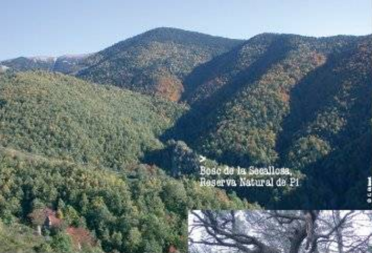
Bosc de la Secallosa, Reserva Natural de Pi