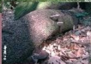
Bolets de soca, al bosc de Blascà (Mieres)