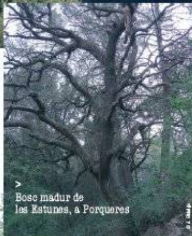
Bosc madur de les Estunes, a Porqueres

Els boscos són una reserva de vida. Protegim-los!