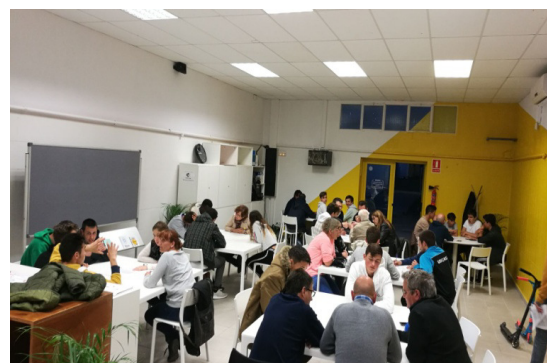
Imatges de diferents tallers de participació. Debat sobre propostes