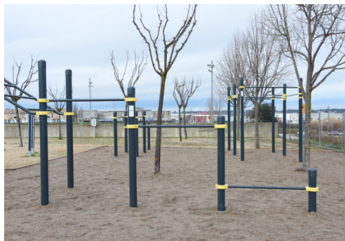
Parc de Cal·listènia