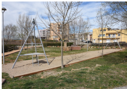
Parc de la Tirolina