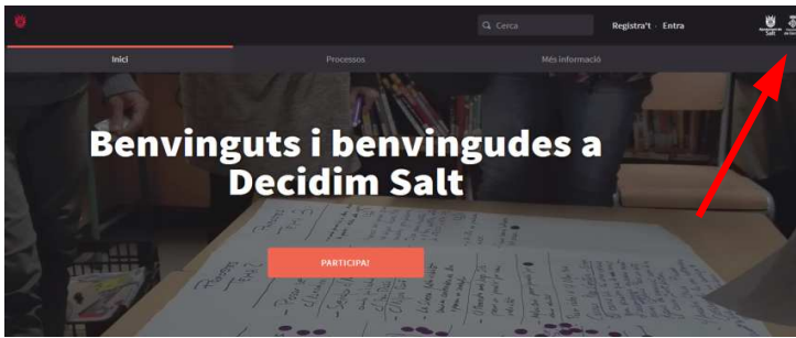
Portada de la plataforma decidim.salt.cat