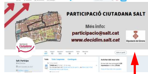
Xarxes Socials: Twitter