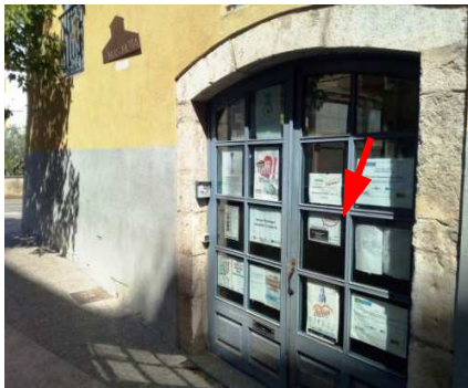
Entrada Mas Mota, Àrea d'Integració i Convivència