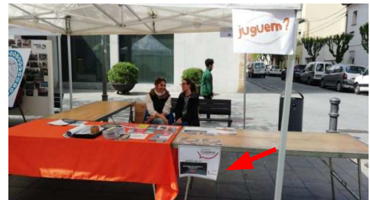
Sant Jordi 2019 a Salt