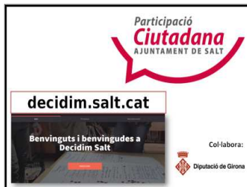
Cartell difusió general (Local Barri Guimerà Centre, etc)